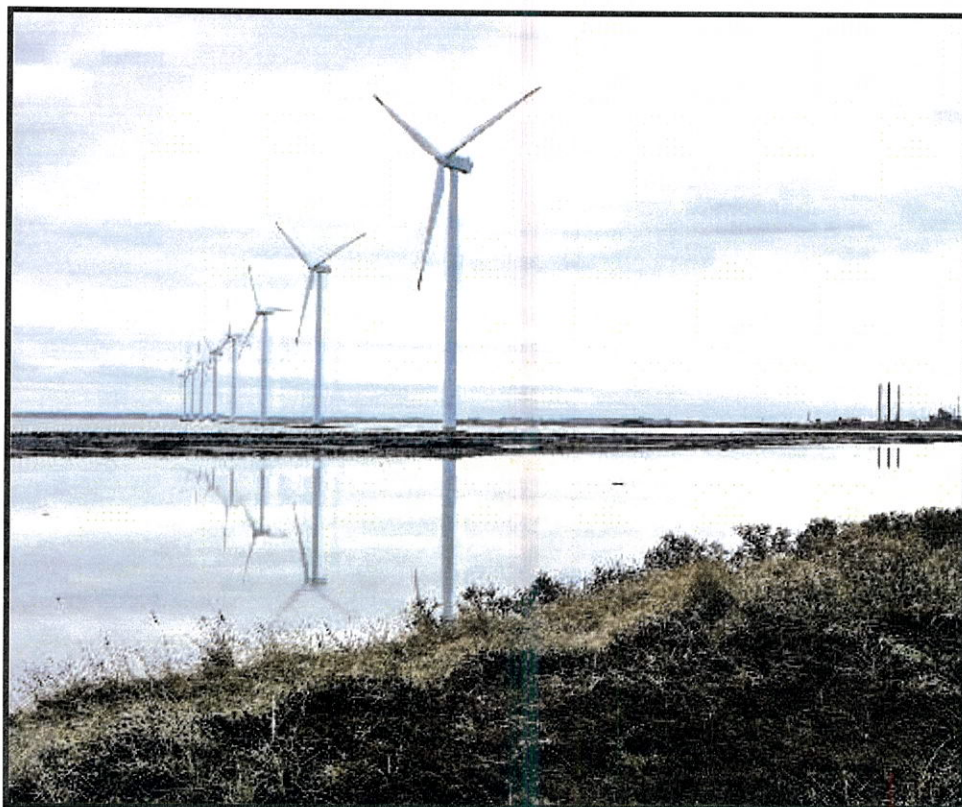
Det forventes, at møllerne kommer til at snurre her på Nissum Bredning inden udgangen af 2017. Arkivfoto